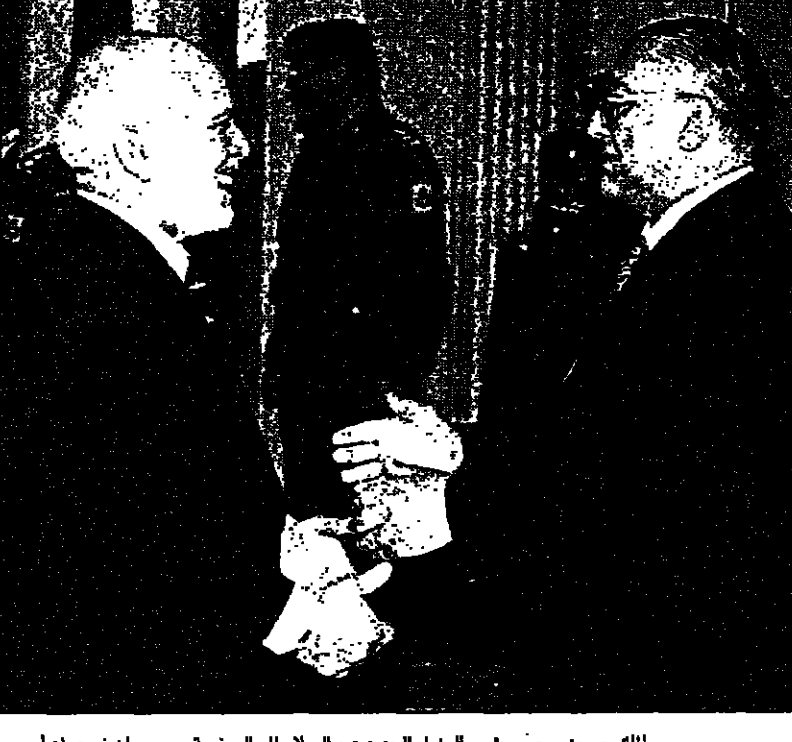
ملك الحسين يرحب برئيس الوزراء الجديد عبد السلام المجالي، في قصر بسمان في عمان أمس ويبدو في الصورة الثانية في حديث جاني مع الكباريتي في قصر رغدان الأسبوع الماضي